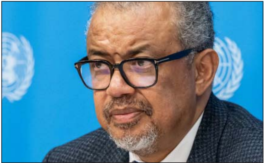
El director de la OMS, Tedros Adhanom Ghebreyesus, responde a las preguntas de los periodistas en una rueda de prensa.

Un mensaje de calma y gratitud En el cierre de su carta, apeló a la memoria colectiva de la pandemia: "Los virus no entienden de política ni respetan fronteras. La mejor inmunidad que tenemos es la solidaridad. Tenerife está demostrando esa solidaridad hoy". "Por favor, cuidense ustedes y cuidense los unos a los otros. Confíen en los preparativos que se han llevado a cabo. Y sepan que la OMS está con ustedes, y con cada persona en ese barco, en cada paso del