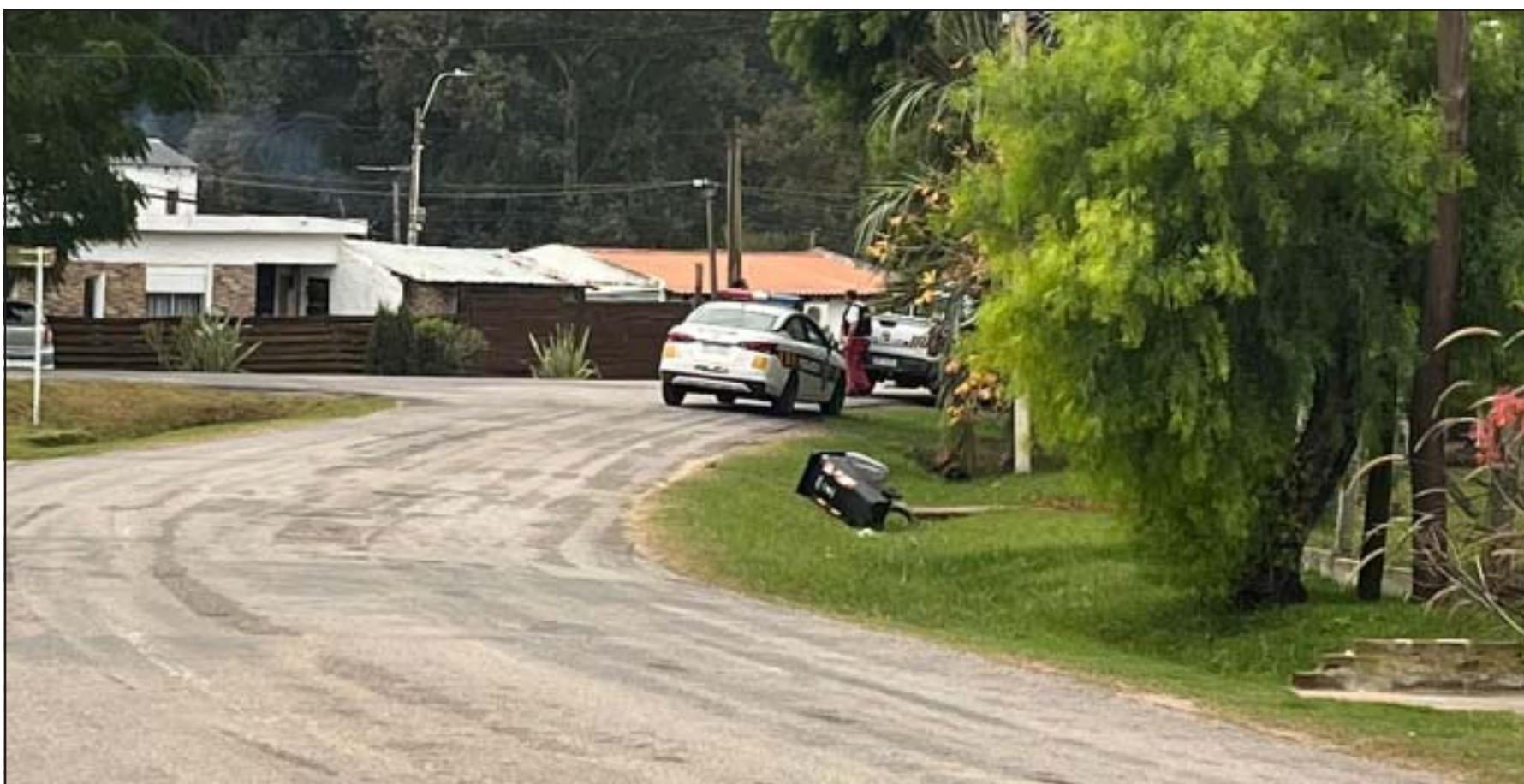
Allanamiento de la Policía por hurto en farmacia Luanda y Abitab Empalme olmos

Uno también fue condenado por rapiña a farmacia Luanda