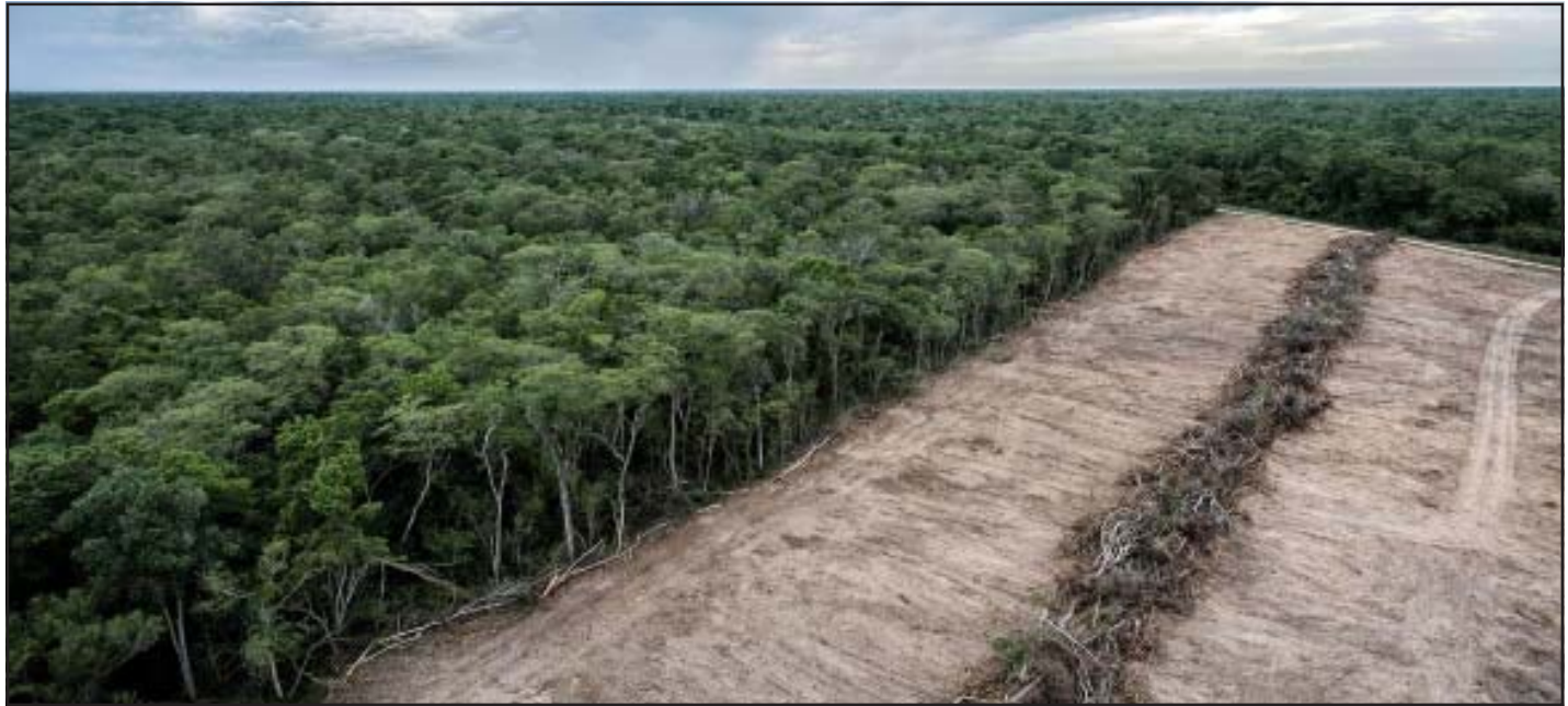
Una de las principales causas de la deforestación en Bolivia es la expansión de la agricultura mecanizada.

Actualmente los bosques ocupan un lugar central en los esfuerzos mundiales contra el cambio climático y la pérdida de biodiversidad. Los gobiernos han prometido detener y revertir la deforestación para 2030, mientras científicos y organismos internacionales subrayan el papel esencial de los bosques para almacenar carbono, regular el agua y sostener millones de medios de vida. Sin embargo, el informe* expone la brecha entre los compromisos políticos y la realidad sobre el terreno: la meta de aumentar la superficie forestal mundial en un 3% para 2030, establecida en el Plan Estratégico de las Naciones Unidas para los Bosques, sigue fuera de rumbo. "Los bosques se encuentran entre los recursos naturales más vitales de nuestro planeta", señala el Secretario General António Guterres en el prólogo, donde advierte que enfrentan crecientes amenazas derivadas de "la deforestación, el aumento de las temperaturas, la incertidumbre económica y las divisiones geopolíticas". Un paisaje boscoso y neblinoso en las montañas del