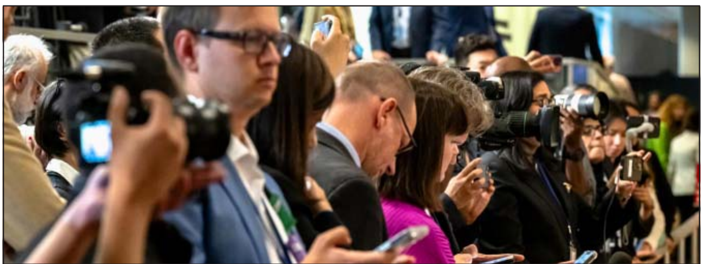
Un grupo de periodistas que cubren las actividades del Consejo de Seguridad de las Naciones Unidas espera una sesión informativa en la zona reservada a los medios de comunicación.

Según el Informe sobre las tendencias mundiales 2022-2025 de la UNESCO, la libertad de prensa ha experimentado su mayor declive desde 2012. Este retroceso es comparable al observado durante los períodos más inestables del siglo XX: las dos guerras mundiales y la Guerra Fría. La manipulación de la información, entre otros, mediante el uso de la inteligencia artificial con fines nocivos, está debilitando la confianza y la seguridad nacional. Al mismo tiempo, los medios de comunicación independientes se enfrentan a una creciente fragilidad económica. La autocensura ha aumentado en más de un 60 %, impulsada por el miedo a las represalias, el acoso en línea, la intimidación judicial y la presión económica. El Día Mundial de la Libertad de Prensa 2026 constituye un momento crucial para reafirmar la libertad de expresión y alinear al periodismo, la tecnología (incluida la IA) y los actores de los derechos humanos en torno a formas prácticas de fortalecer los ecosistemas de información para el futuro. Organizado en Lusaka (Zambia), las celebraciones del Día este 2026 reúnen a activistas por la libertad de prensa y comunidades de derechos digitales en un momento en que las fronteras entre el periodismo, la tecnología, el espacio cí-