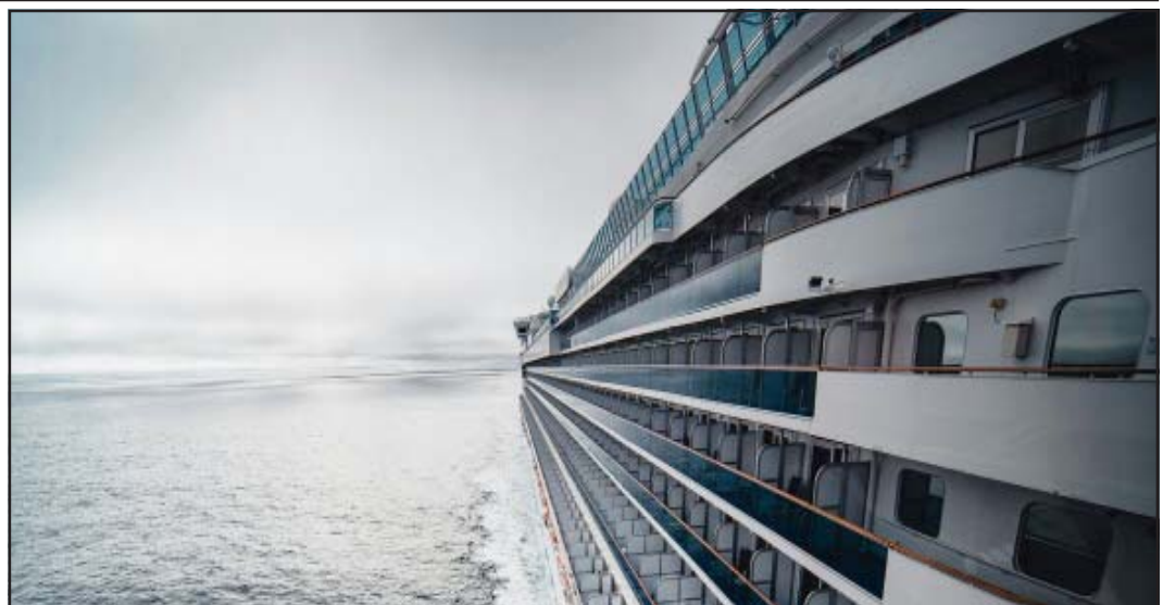
Un crucero navega por el océano.

El barco tiene previsto continuar hacia las Islas Canarias. Antes de la llegada, la doctora Van Kerkhove declaró que la OMS está trabajando con las autoridades españolas, que "han dicho que recibirán el barco para realizar una investigación epidemiológica completa, una desinfección total del barco y, por supuesto, para evaluar el riesgo de los pasajeros". Los hantavirus son transmitidos por roedores y pueden causar enfermedades graves en los seres humanos. Se estima que cada año se producen miles de infecciones. Las personas suelen infectarse por contacto con roedores infectados o con su orina, heces o saliva. Al hablar de los posibles orígenes del brote, la doctora Van Kerkhove declaró que los primeros pacientes, un matrimonio, subieron al barco en Argentina. "Teniendo en cuenta el período de incubación del hantavirus, que puede ser de una a seis semanas, suponemos que se infectaron fuera del barco", afirmó. "Se trataba de un barco de expedición... muchas de las personas a bordo estaban observando aves" y "viendo mucha fauna diferente". El crucero hizo escala en varias islas frente a la