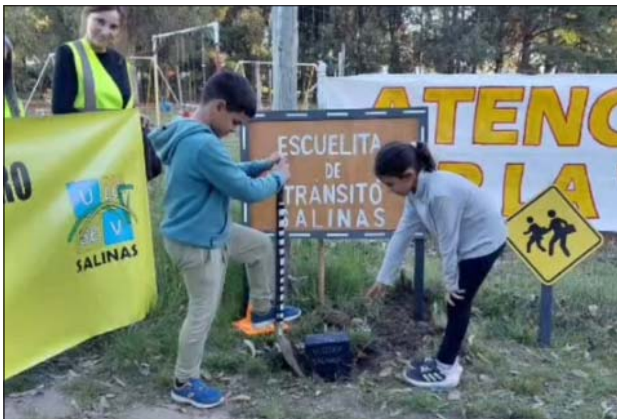
Niños colocaron piedra fundamental de la futura Escuelita de Tránsito de Salinas